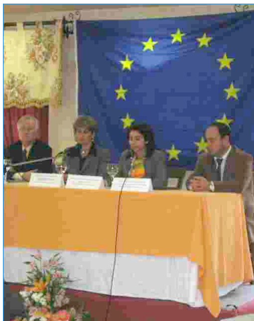
Jornadas celebradas en Caravaca de la Cruz