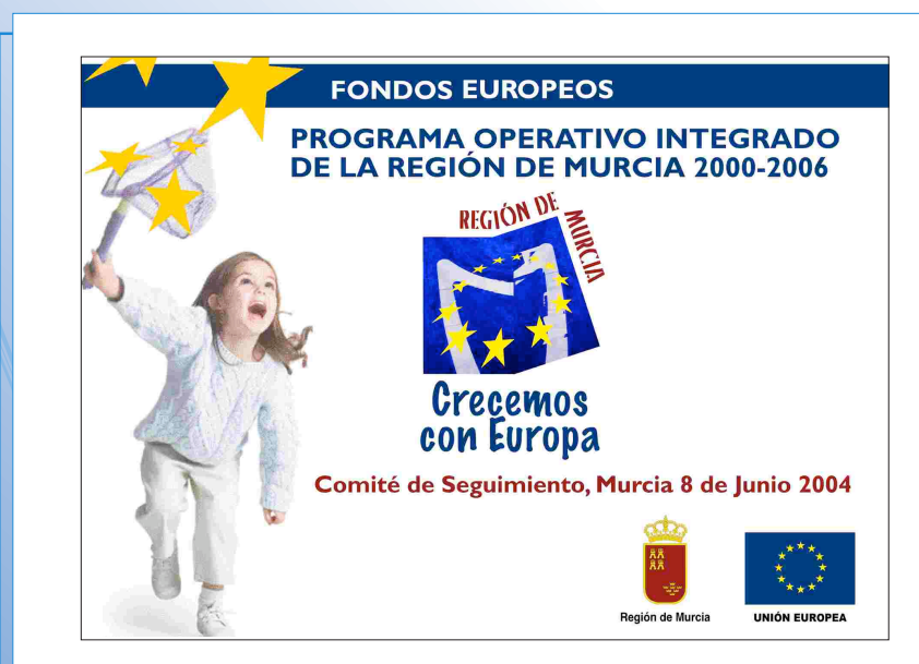
Imagen del Set de prensa

Para acompañar los diversos eventos relacionados con el Programa Operativo Integrado de Murcia, se ha creado un set de prensa, a modo de panel.