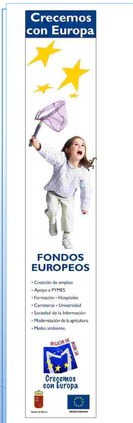
Boceto del mupi del POI de Murcia

Entre las actuaciones especiales del Plan de Información y Publicidad del POI de Murcia se encuentra también el diseño de un mupi para las paradas de autobuses.