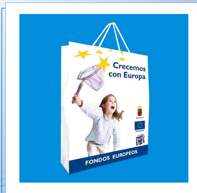
Bolsa del POI de Murcia

impresas por las dos caras, a cuatro tintas y con un asa de cordoncillo de papel, que serán utilizadas en numerosos actos.