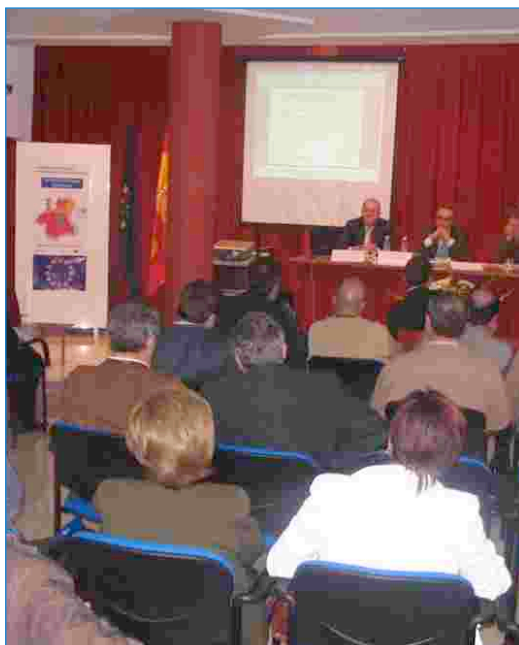
Jornadas celebradas en Yecla

Los funcionarios de esta Comunidad Autónoma, técnicos de los Ayuntamientos de la Región, Mancomunidades de Municipios, Comarcas y Agencias de Desarrollo Local han sido los principales beneficiarios del curso de formación sobre “Sistema de Información de Fondos Europeos y otras Fuentes de información en Internet sobre la UE”, que comenzó en marzo de 2004.