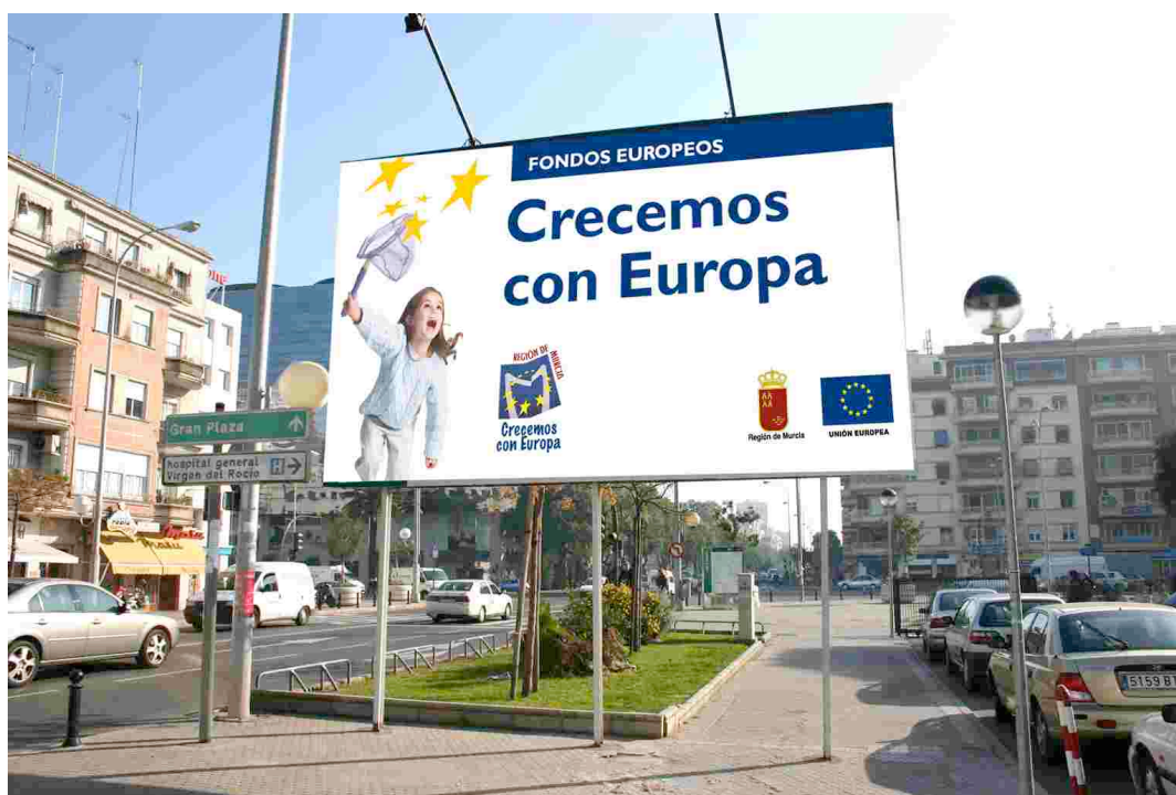
Imagen ficticia de valla publicitaria

El Plan de Información y Publicidad del POI de Murcia incluye el diseño y la creatividad de vallas publicitarias, dejando la opción de planificar circuitos de vallas.