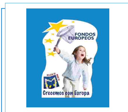
Imagen del imán

cazamariposas, junto al logo de la Región de Murcia y al eslogan “Crecemos con Europa”.