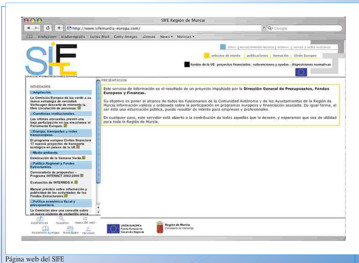
Página web del SIFE

de la Administración Regional y Local, así como de la ciudadanía al funcionamiento de las instituciones comunitarias, y a las posibilidades de financiación de proyectos e iniciativas que ofrece la Unión Europea.