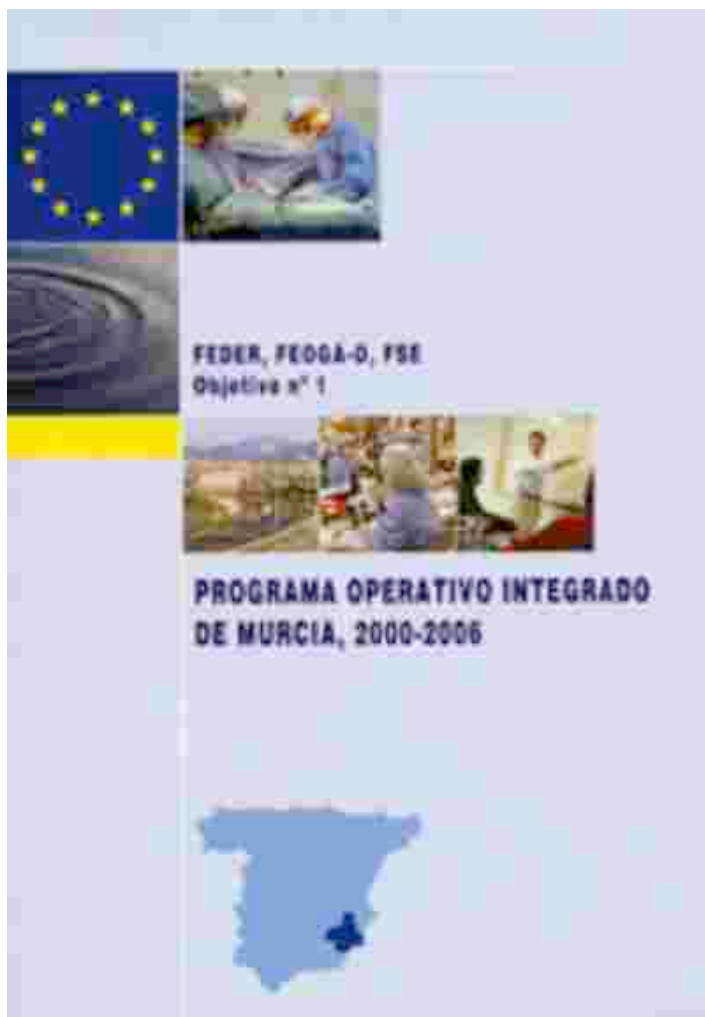
Portada de la publicación del POI de Murcia 2000-2006

El Manual Práctico sobre Información y Publicidad de las actividades de los Fondos Estructurales, del que se han publicado dos ediciones (en septiembre de 2001 y abril de 2004).