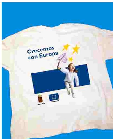
Frente y espalda de camiseta del POI de Murcia